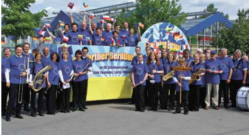
„Wir leben Europa“, unter diesem Motto nahmen die Partnerstädte Rheine, Borne, Trakai (Litauen), Leiria (Portugal), Fourmies (Frankreich), Tarnowski Gory (Polen) und Chomutov (Tschechien) mit dem in Rheine gebauten Festwagen am Jubiläumsumzug der Partnerstadt Bernburg zum 1050. Geburtstag der Stadt im Mai 2011 teil

Für die Zulässigkeit einer finanziellen Förderung ist die Bindung an den eigenen Aufgabenkreis grundlegend. Zuwendungen aus sonstigem Anlass sind ausnahmsweise zulässig, wenn sie mit einer angemessenen Gegenleistung verbunden sind. Dieses Kriterium würde beispielsweise die Unterstützung eines Jugendheimes, in dem Begegnungen von Jugendlichen beider Gemeinden abgehalten werden sollen, erfüllen. Der Bezug zum örtlichen Wirkungskreis besteht auch, wenn der Grund der Unterstützung in einer besonderen langjährigen Verbindung beider Gemeinden liegt.