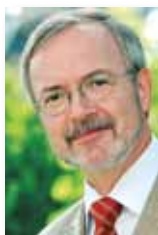
Dr. Werner Hoyer Mitglied des Deutschen Bundestages Staatsminister im Auswärtigen Amt Beauftragter für die deutsch-französische Zusammenarbeit