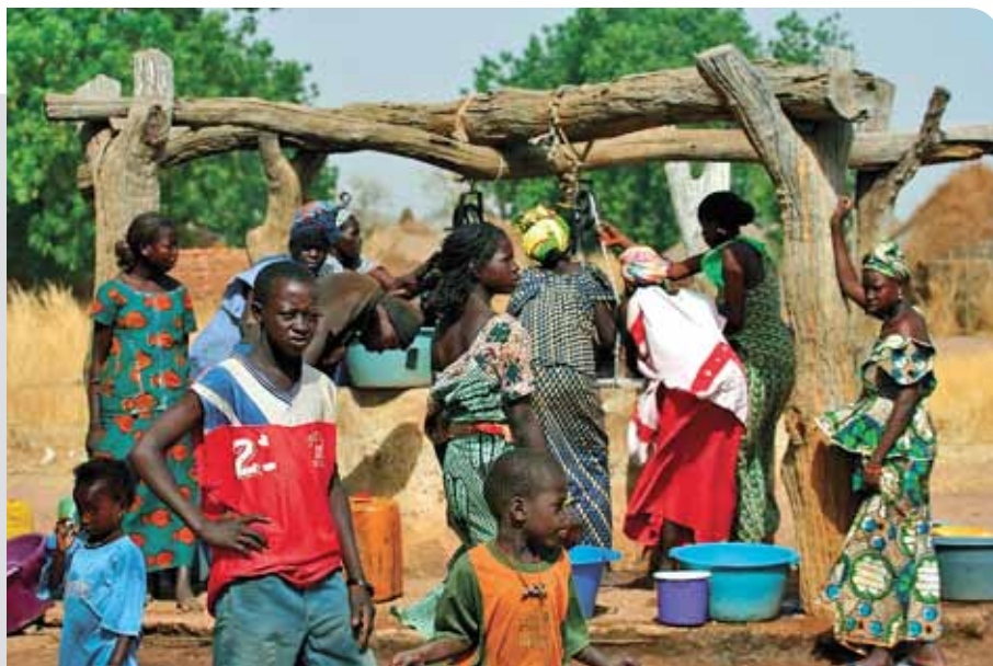
Wassergewinnung in Wassadou, Senegal

Die Servicestelle bietet lokalen Akteuren zahlreiche Informationsmöglichkeiten. Sie reichen von der Fachpublikationsreihe „Dialog Global“ und einer eigenen Materialreihe über den monatlichen Newsletter „Eine Welt Nachrichten“ bis hin zu der umfangreichen Internetplattform www.service-eine-welt.de mit