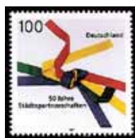
1997 wurde die Briefmarke „50 Jahre Städtepartnerschaften“ herausgegeben

sind hinzugekommen. Städtepartnerschaften sind heute auch eine Form der kommunalen fachlichen Zusammenarbeit und des Erfahrungsaustausches. In ihnen wird eine Möglichkeit der gemeinsamen Wirtschaftsförderung und der Etablierung wirtschaftlicher Beziehungen gesehen. Ein Beispiel hierfür sind zum Beispiel die von den Regierungen in Deutschland und Russland unterstützten und koordinierten Bemühungen, über Städtepartnerschaften zu einem gegenseitigen Austausch und der wirtschaftlichen Zusammenarbeit bei den Themen Stadtentwicklung und öffentliche Daseinsvorsorgeinfrastruktur zu kommen.