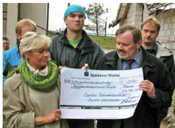
Soziale Projekte wie der Bau und die Erweiterung der Behindertenwerkstatt in Trakai kennzeichnen die Zusammenarbeit der Partnerstädte Rheine, Bernburg, Borne (NL) und Trakai (Litauen). Vertreter des Caritasverbandes Rheine überreichten eine Spende für die Behindertenarbeit in Trakai

Noch immer steht die Begegnung der Menschen im Vordergrund: Durch das Zusammentreffen der Bürgerschaft, der Jugend, des Kulturaustauschs, in Schulpartnerschaften und dem Austausch der Kommunalpolitik und Kommunalverwaltungen. Aber weitere Aktivitäten