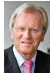
Heinrich Haasis Präsident des Deutschen Sparkassen- und Giroverbandes