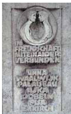
Stadt Unna: Beispiel für funktionierende Freundschaften und Partnerschaften. Links: Der Friedensstein im Rathaus

In einer zurückliegenden Antragstranche (Antragsfrist 15. Februar 2010) wurden in der Aktion 1, Maßnahme 1.1, europaweit 249 Projekte ausgewählt, davon 45 aus Deutschland. Jedoch erhielten in der Maßnahme 1.2, der thematischen Netzwerkbildung zwischen Partnerstädten, nur wenige Kommunen einen Zuschlag. Da die EACEA künftig stärker auf Netzwerke setzt und sie in diesen die Entwicklung einer thematischen und langfristigen Zusammenarbeit sieht, sollten Kommunen diese Maßnahme